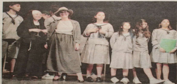
Nelle foto alcune scene delle prove dello spettacolo «Edelweiss»

Il film ha avuto un grande successo, dovuto non solo alla presenza della neo diva Julie Andrews, ma anche alle musiche di Richard Rodgers, tra cui figura la famosissima «My Favorite Things». Tra i vari brani si ricordano anche «Quindici anni, quasi sedici», «Edelweiss», «Le cose che piacciono a me», «Il suono della